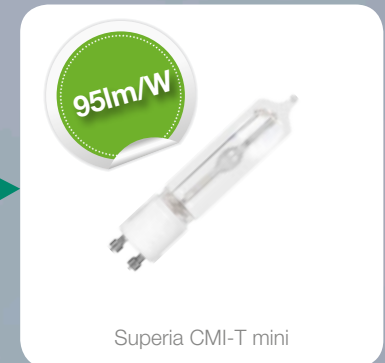
Superia CMI-T mini